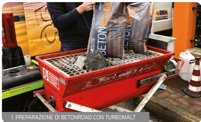
1. PREPARAZIONE DI BETONROAD CON TURBOMALT