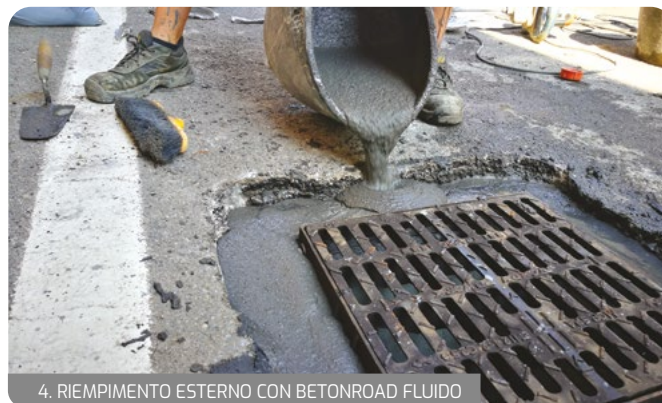
4. RIEMPIMENTO ESTERNO CON BETONROAD FLUIDO