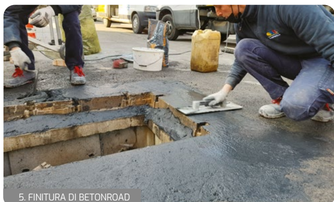
5. FINITURA DI BETONROAD