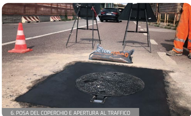
6. POSA DEL COPERCHIO E APERTURA AL TRAFFICO