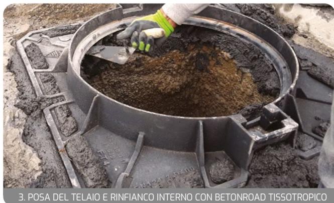
3. POSA DEL TELAIO E RINFIANCO INTERNO CON BETONROAD TISSOTROPICO