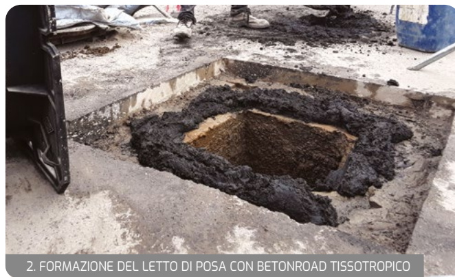
2. FORMAZIONE DEL LETTO DI POSA CON BETONROAD TISSOTROPICO